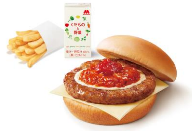
【ワイワイモスチーズバーガーセット】

※4 セットドリンク対象のコールドドリンクや、プラス 50 円でモスシェイク S もお選びいただけます。