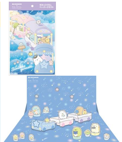
すみっこぐらし ペーパークラフト

今回は、サンエックス株式会社の人気キャラクター『すみっこぐらし』とコラボしたおもちゃを用意しました。おもちゃは、ヨーヨー、シール、ばんそうこう、ペーパークラフトの4種類で、どれも今回のコラボでしか手に入らない、限定デザインです。対象のお子さま向けセットや低アレルゲンメニューのセットのご購入で、好きなおもちゃを1つお選びいただけます※2。また、ハンバーガーの包装紙や紙バッグなどの包材にも『すみっこぐらし』が登場します。本企画を通じて、新たにモスバーガーをご利用くださる方やファミリー層のお客さまにも、よりお楽しみいただけるサービスのご提供を目指します。