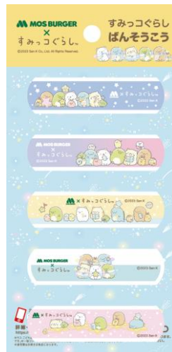
すみっこぐらし ばんそうこう