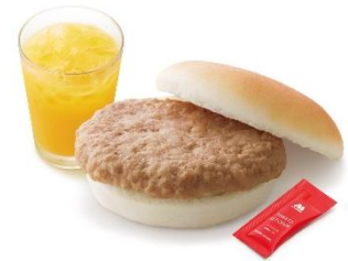
【ポークサンド<米粉> ドリンクとおもちゃ付きセット】