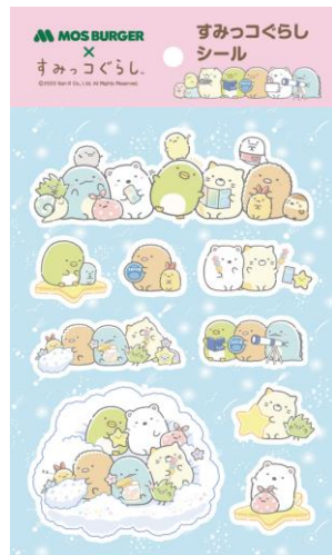
すみっこぐらし シール