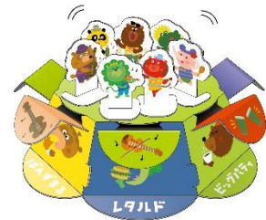
【とんとんミュージカルパレード】