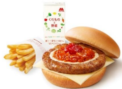
【ワイワイモスチーズバーガーセット】