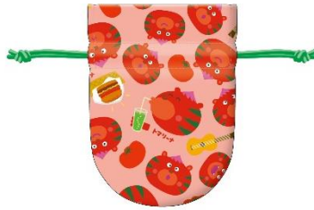
【トマリーナのトマトきんちゃく】