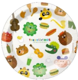
(5枚セット) 【はらぺこプレートセット】