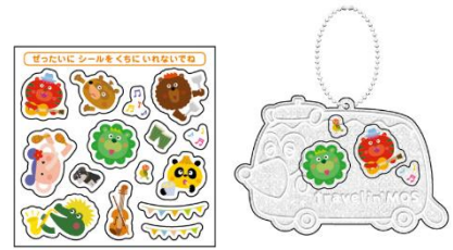
【ばんずまるの はんしゃキーホルダー】