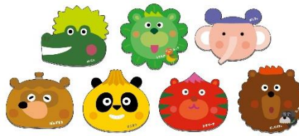
【トラベリンモスの ペーパーコースター】