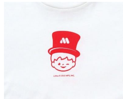
<Tシャツ (3) >