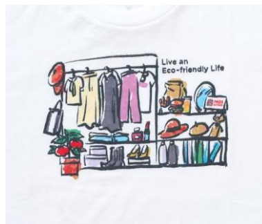
<Tシャツ (2) >