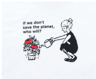
<Tシャツ (1) >