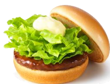
テリヤキバーガー