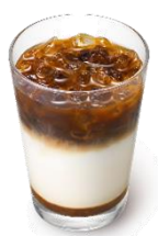
数量限定 まぜるドリンク アイス塩キャラメルラテ 〈クリスマス島の塩®使用〉