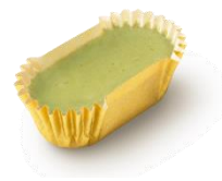
期間限定 ひんやりドルチェ ピスタチオ&ラズベリー