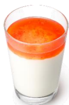
期間限定 まぜるシェイク いちご ※ソースに栃木県産スカイベリー を使用し、果肉 2.8%です。