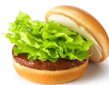
期間限定 クリームチーズテリヤキ バーガー