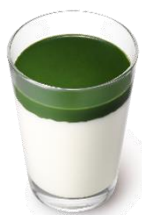
まぜるシェイク ほろにが抹茶