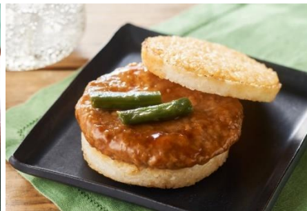
モスライスバーガーつくね (Oisixバージョン)