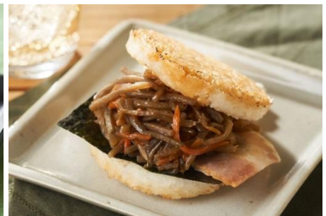
モスライスバーガーきんぴら (Oisixバージョン)