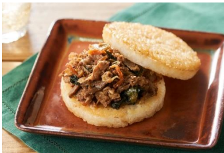
モスライスバーガー焼肉 (Oisixバージョン)

モスバーガーを展開する株式会社モスフードサービス(代表取締役社長:中村 栄輔、本社:東京都品川区)は、食品のサブスクリプションサービスを提供するオイシックス・ラ・大地株式会社(本社:東京都品川区、代表取締役社長:高島 宏平)が運営する『Oisix』にて定期会員限定で3種類の「モスライスバーガー」(Oisixバージョン)を11月11日(木)より販売いたします。なお、『Oisix』とのコラボレーションは、昨年のミールキット商品、Kit Oisix「時を忘れる魅惑のボロネーゼ/角切りトマトと赤玉ねぎのマリネ」に続き2回目となります。