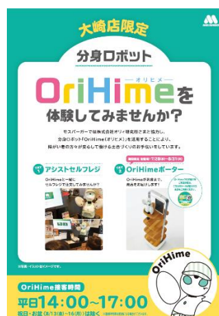
【OriHime ポスターイメージ】