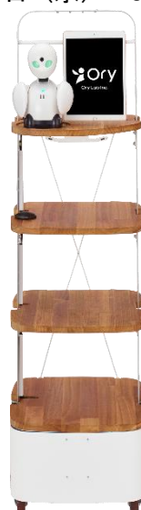
【OriHime Porter イメージ】

当社では、時代にあったモスバーガーらしいホスピタリティの形を追求し、テクノロジーを活用しながら、人ならではのあたたかみのある接客について研究を続けています。昨年7月には、オリィ研究所と協力し「OriHime」を介してパイロット※2と会話しながらゆっくりと商品を注文できる「ゆっくりレジ」の実証実験を開始しました。さらに、昨年11月からは、レジ操作を利用者自身で行うセルフレジをサポートする「アシストセルフレジ」のテストも行っています。