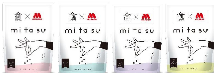
【mitasu×MOS BURGER お得な4種セット 特別バージョン】

※1 モスバーガー店舗で使用する野菜の生産者で、当社が独自に関係構築した全国約100産地、約2,700軒（2020年度）の農家のことです。できるだけ農薬や化学肥料に頼らない方法で栽培しています。