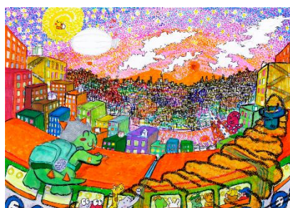
【作品例：ぼくのすきなまちのゆうひ】