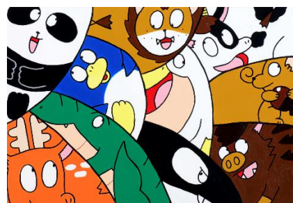
【作品例：どうぶつパズル2】

「新潟 MOS ごと美術館※1」は、新潟県の「まちごと美術館 cotocoto」事業に賛同し、2016年に県内の店舗でスタートした企画で、今回で4回目の実施となります。食べ物や風景など、ほっこり楽しんで元気が出る、またお店の雰囲気合う作品を各店舗2点ずつ展示、店ごとにさまざまなアートをご鑑賞いただけます。また作品には作者の紹介を添えて展示し、障がい者アートがより身近に感じられる工夫をします。モスバーガーを通じて、障がい者アートに触れる機会を創出することで、地域、施設、作家ご本人やご家族から多く反響をいただいています。